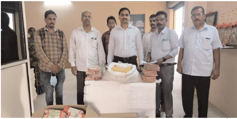
గుంటూరు : మే 25 (ఆంధ్రపత్రిక) : గుంటూరు నగరం ఏలుకూరు రోడ్డు లో ఉన్న సింధూరి సీడ్స్ ప్రైవేట్ లిమిటెడ్ “ సంస్థ లో కల్పి మిర్చి విత్తనాలు అమ్ముచున్నట్లు రాబడిని సమచారంతో, ఆంధ్ర ప్రదేశ్ రాష్ట్ర విజిలెన్స్ ఎన్ఫోర్స్ మెంట్ ఇన్ స్పెక్టర్ జనరల్ వారి ఆదేశముల మేరకు, గుంటూరు