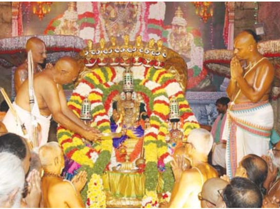
తిరుమల, మే 16(ఆంధ్రపత్రిక):తిరుపతి శ్రీ గోవిందరాజ స్వామి బ్రహ్మోత్సవాల్లో మొదటిరోజు గురువారం రాత్రి 7 గంటలకు పెద్దశేష వాహనంపై శ్రీదేవి, భూదేవి సమేత శ్రీ గోవిందరాజస్వామి