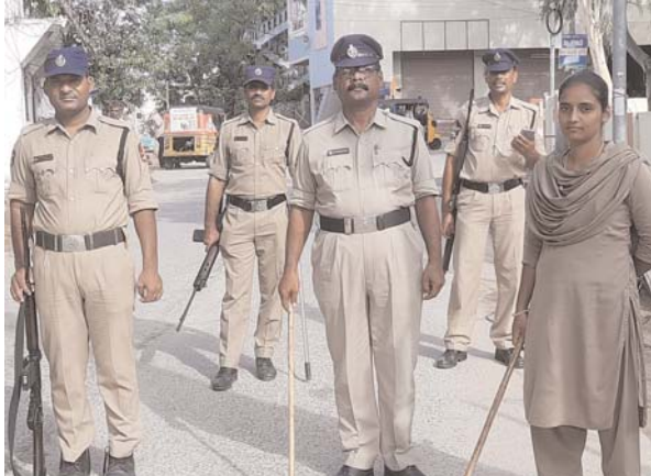
గురించి ప్రజలకు అవగాహన కల్పిస్తూ ఎవరు కూడా చట్ట వ్యతిరేక చర్యలు తీసుకుంటామని జిల్లా ఎస్పీ హెచ్చరించారు.