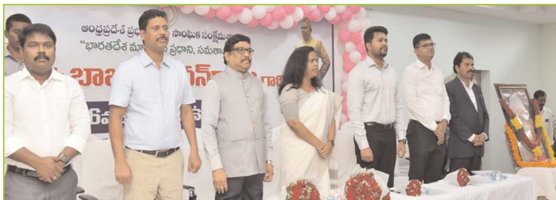
కలలు కనండి.. వాటి సాకారానికి శ్రమించండి