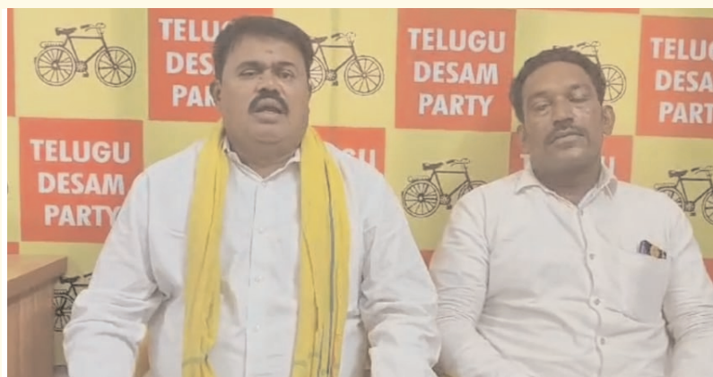
హిందూపురం, ఏప్రిల్ 4 ( ఆంధ్రపత్రిక ): వాలంటీర్లకు తెలుగుదేశం పార్టీ వ్యతిరేకంగా ఉందన్నది