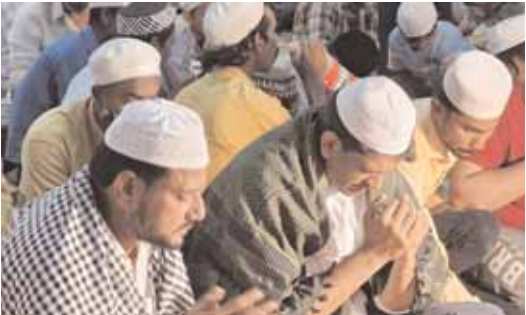
పూజలు, సమాజ్ కార్యక్రమాల్లో పెమ్మసాని పాల్గొన్నారు. గుంటూరు

గుంటూరు, మార్చి 23 (ఆంధ్రపత్రిక): సమయ పాన, మత విశ్వాసానికి ముస్లిం సోదరులు పెద్దింది పేరు అని గుంటూరు పార్లమెంట్ టీడీపీ అభ్యర్థి డా. పెమ్మసాని చంద్రశేఖర్ తెలిపారు. గుంటూరులోని స్థానిక లాలాపేటలో గల ఎక్వార్ల మనీదులో శనివా రం జరిగిన ఉపవాస విరమణ కార్యక్రమానికి ముఖ్య అతిథిగా పెమ్మ సాని పాల్గొన్నారు. రంజాన్ మాసం సందర్భంగా ప్రపంచ ఆదేశాను సారం ముస్లిం సోదరులు ప్రతిష్టాత్మకంగా నెలలపాటు పాటించే కఠోర ఉపవాస దీక్షలలో భాగంగా 12వ రోజు జరిగిన రోజా విరమణ కార్యక్రమంలో ఆయన పాల్గొన్నారు. కాగా మనీదులో ప్రత్యేక